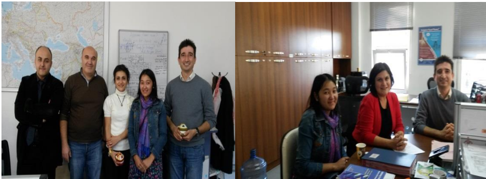
Fotoğraf 4: 2014-2015 Mevlana Değişim Programı ile Uluslararası Atatürk Alatoo Üniversitesi’nden Öğretim Elemanı üniversitemizde Ders Verme Hareketliliğini gerçekleştirdi.

Bakü Devlet Üniversitesi Jeoloji Mühendisliği’nden 1 yüksek lisans öğrencisi 15 Eylül 2014 tarihinde Mühendislik Fakültesi Jeoloji Mühendisliği Bölümünde öğrenimine başlamış ve Güz Yarıyılı süresince öğrenimine hibeli olarak devam edecektir. Fen-Edebiyat Fakültesi, İngiliz Dili ve Edebiyatı Bölümüne Kırgızistan-Uluslararası Atatürk Alatoo Üniversitesi’nden 1 öğretim elemanı 20-24 Ekim 2014 tarihleri arasında ders verme hareketliliğini gerçekleştirmiş ve üniversitemizden memnun kalarak ülkesine dönmüştür (Fotoğraf 4.).