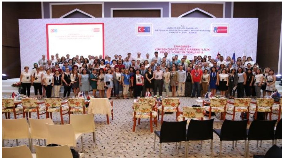
Fotoğraf 6: Antalya Yükseköğretimde Öğrenci ve Personel Hareketliliği Proje Yönetim Toplantısından Bir Kare.