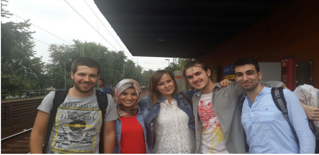
Fotoğraf 2: 2014-2015 Erasmus+ Değişim Programı ile Macaristan'da Öğrenim Hareketliliği'nde Olan ve Staj Hareketliliği'ne Katılan Öğrencilerimizden Bir Kare.

Tablo 4'te aynı zamanda görüldüğü üzere, 2014-2015 Akademik Yılı Erasmus+ Programı ile değişimden yararlanan Avrupa'nın farklı ülkelerinden 9 öğrenci üniversitemizde öğrenim görmek üzere Zonguldak'ta bulunmaktadır. Çek Cumhuriyeti'nden 1 erkek doktora öğrencisi İktisadi ve İdari Bilimler Fakültesi İşletme Bölümü'nde ve 1 erkek lisans öğrencisi Beden Eğitimi ve Spor Yüksekokulunda öğrenimlerine başlamıştır. Romanya'dan 1 erkek lisans öğrencisi Mühendislik Fakültesi Geomatik Bölümüne, Litvanya'dan 5 kadın öğrenci Denizcilik Fakültesi, Denizcilik İşletmeleri Yönetimi Bölümü'ne, İspanya'dan 1 kadın öğrenci ise Ereğli Eğitim Fakültesi Sınıf Öğretmenliği Bölümü'ne değişim öğrencisi olarak kabul edilmiştir.