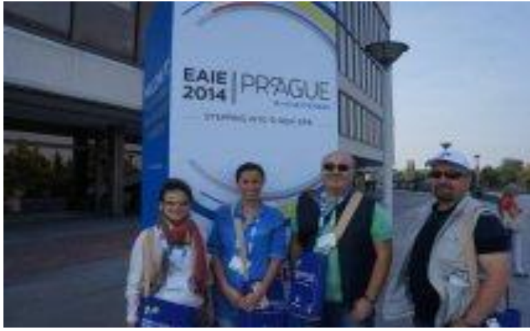
Fotoğraf 5: Prag/Çek Cumhuriyeti 26. EAIE (European Association for International Education) Toplantısından Bir Kare.

2013-2014 Akademik Yılı Erasmus-Farabi-Mevlana Değişim Programları hakkında güncel gelişmeleri takip etmek ve programların işleyişi hakkında katılımcı üniversiteler arasında bilgi alış verişinde bulunmak ve programların işleyiş kalitesini artırmak, üniversitemiz öğrenci ve akademik personelin programlardan en üst seviyede en doğru şekilde faydalanabilmelerini sağlamak amacıyla çeşitli toplantılara iştirak edilmiştir (Fotoğraf 5.,6.). Katılınal tüm etkinlikler Tablo 10’da sıralanmıştır.