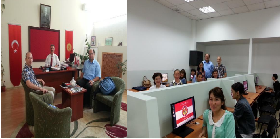
Fotoğraf 3: 2014-2015 Mevlana Değişim Programı ile Öğretim Elemanlarımız Kırgızistan-Türkiye Manas Üniversitesi’nde Ders Verme Hareketliliğini gerçekleştirdi.

Tablo 6’da görüldüğü üzere, 2014-2015 Akademik Yılı Güz Dönemi hareketliliği kapsamında Çaycuma Meslek Yüksekokulu 2 öğretim elemanımız 15-19 Eylül 2014 tarihleri arasında Kırgızistan’da Kırgızistan-Türkiye Manas Üniversitesi Meslek Yüksek Okulunda Mevlana ders verme hareketliliğine katıldılar (Fotoğraf 3.).