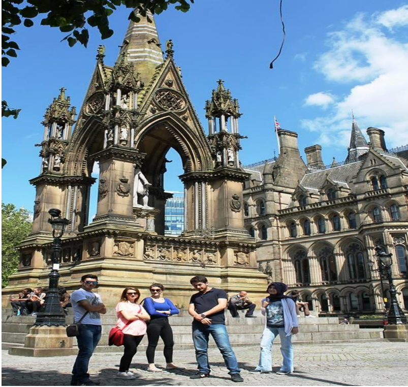
Fotoęraf 1: 2013-2014 Hayat Boyu Öğrenme/LLP Erasmus Deęişim Programı ile İngiltere'de Staj Hareketlilięi'ne Katılan Öğrencilerimizden Bir Kare.

Hayat Boyu Öğrenme/LLP Erasmus Staj Hareketlilięi 2013-2014 Akademik Yılı Yaz Döneminde gerçekleşmiş ve toplam 13 öęrencimiz bu programdan faydalandırılmıştır. İktisadi ve İdari Bilimler Fakültesi'nden 5 öęrencimiz staj hareketlilięinden faydalanırken, 3 öęrencimiz Fen-Edebiyat Fakültesi'nden, 2 öęrencimiz Mühendislik Fakültesi'nden ve 1'er öęrencimiz Denizcilik ve Tıp Fakültelerinden İngiltere (10), İtalya (1), Macaristan (1) ve Polonya (1) gibi ülkelerde staj faaliyetlerini tamamlamışlardır. Staj Hareketlilięinden faydalanan 10'u erkek ve 3'ü kadın öęrencilerimizin hepsi lisans öęrencisidir. Bu hareketlilikten yararlanan öęrenciler sadece mesleki becerilerini geliştirmekle kalmayıp kültürel deęişimi de sağlamaktadırlar (Fotoęraf 1.)